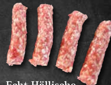
Echt Hällische Lamm-Cevapcici