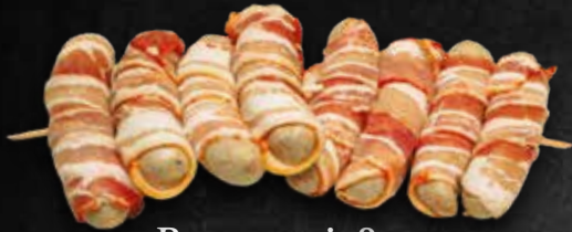
Bauernspieß ohne fleisch