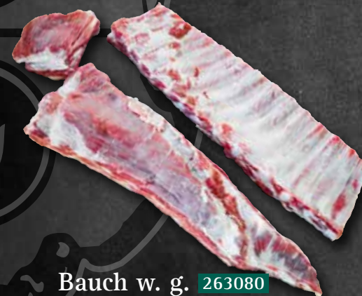
Bauch w. g. 263080 zerlegt in: St. Louis-Rib 263243 (hinten) und „Das Flap“ (links am Rand)