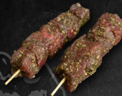
Rinderspieß aus der Hüfte, in Kräutermarinade