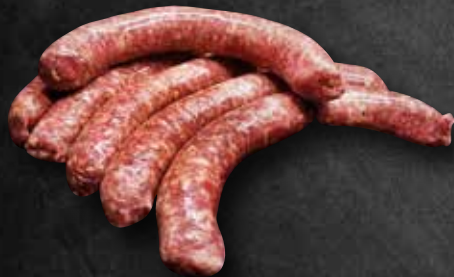
Echt Hällische Lammsbratwurst 52219