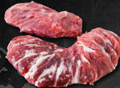
Hohenloher Spinne Kachelfleisch vom Rind 302241