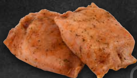
Griechische Tasche Geifertshofener Bio-Hirten- käse g.t.S.