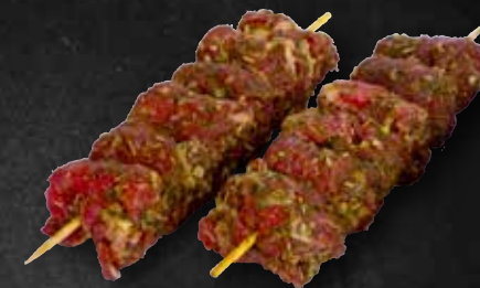
Rinderspieß BBQ mariniert