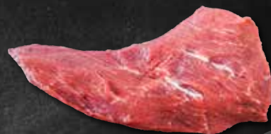
Hohenloher TriTip Bürgermeisterstück vom Rind 302038