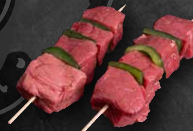
Rinderspieße aus der Keule, mit Paprika