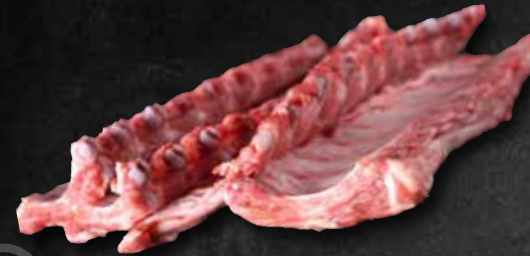
Leiterle „Babybackribs“ 263094