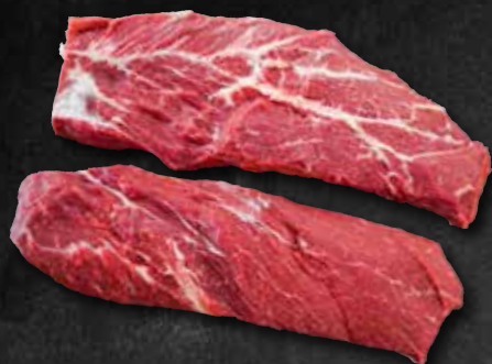
Hohenloher Flat-Iron „zerlegt“ Bugblatt vom Rind 302547