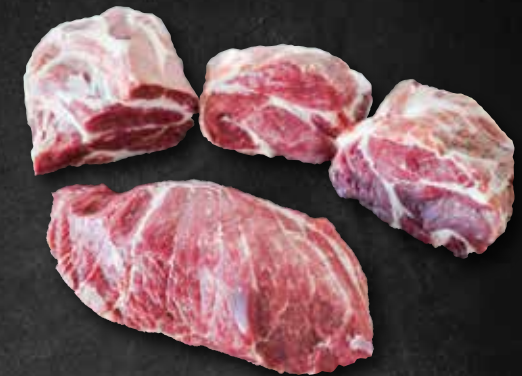
HALS zerlegt in: Halssteak (hinten) Kernhals „Presa“ (vorne) 263061