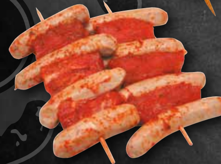
Bauernspieß mit fleisch