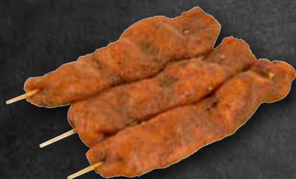
Knabberspieße mit Geifertshofener Bio-Heumilchkäse g.t.S. und Röstzwiebeln