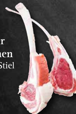
Hohenloher Lammstelzen / Lammhaxen