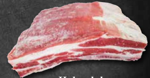
Hohenloher Short Rib vom Rind 302064