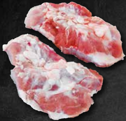
Kachelfleisch / Spider Steak 263241