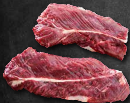
Hohenloher Onglet Nierenzapfen vom Rind 302205