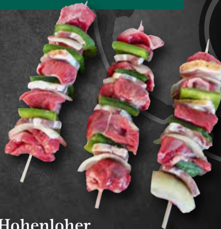
Hohenloher Lammspieße „Rhodos“ 422144