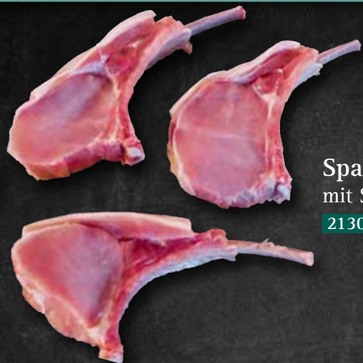
Spanferkelkronen mit Stielknochen