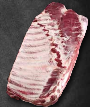
Spareribs dick 263096