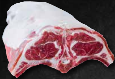
Hohenloher Lammsattel wie gewachsen 422050