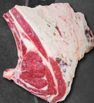
Hohenloher Rinderschoß wie gewachsen 302053 Rinderschoß Dry aged 302055