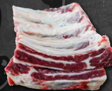
Hohenloher Rinder-Leiterstück 302094