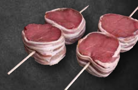
Kalbsfleischspieß mit Speck umwickelt