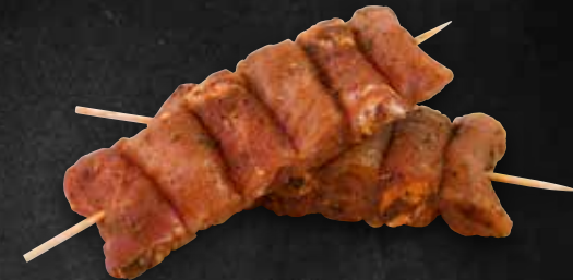
Barbecue Grillspieß in Paprikamarinade