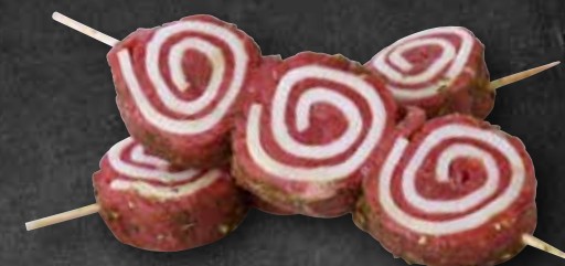
Calypso vom Rind mit Lardo