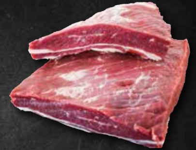
Hohenloher Brisket Brustkern vom Rind 302083