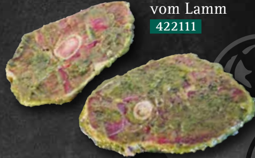
Hohenloher Holzfällersteak mariniert vom Lamm 422111