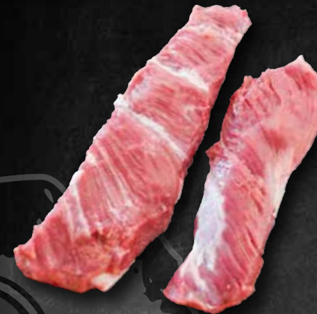
Kronfleisch „Skirt“ 263254