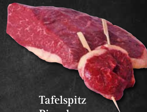
Tafelspitz Picanha 302036