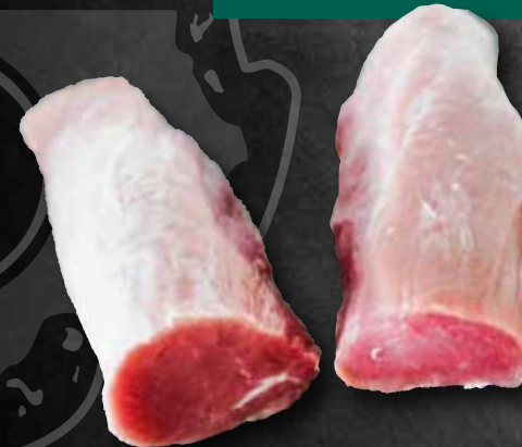
Filet Mittelstück „Solomillo“ 263075