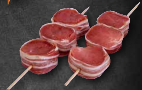
Schweinefiletspieß mit Speck umwickelt