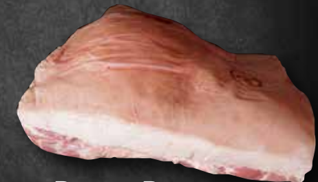
Boston-Butt Schulter mit Hals 263244