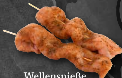
Wellenspieße von Rücken, mariniert