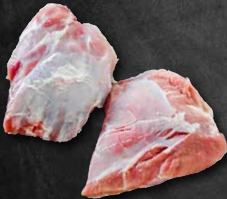
„Cuscino“ Schulterschauffelläpple 263245