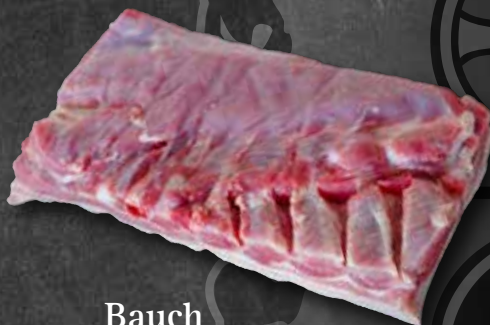
Bauch ohne Knochen zugeschnitten vom Spanferkel 213084